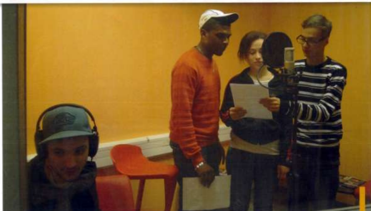
Les élèves de l'École de la deuxième chance avec l'aide de l'association La prose des sables, ont enregistré un CD intitulé « Empreintes ».

Envoyez votre article à valencemensuel@mairie-valence.fr