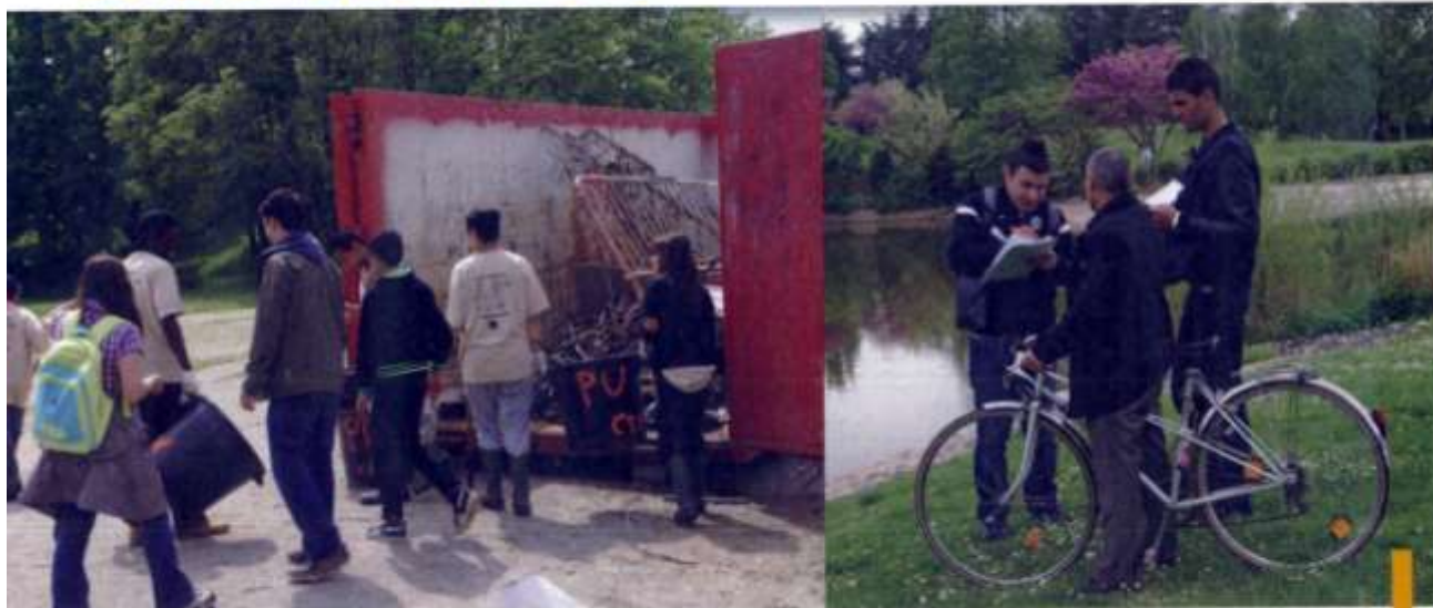
Les reportages réalisés sur le nettoyage du lac du parc Perdrix et du parc des Trinitaires seront présentés le 12 octobre dans le cadre de la Journée citoyenne.