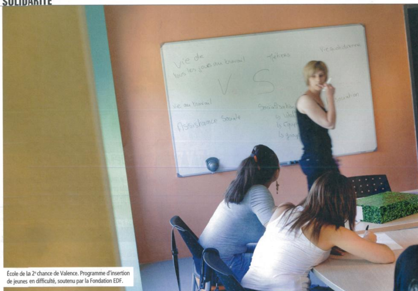
École de la 2 e chance de Valence. Programme d'insertion de jeunes en difficulté, soutenu par la Fondation EDF.