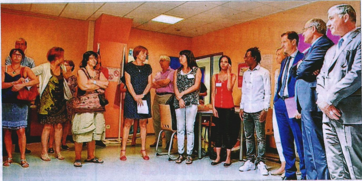
Ci-dessus : l'inauguration de la salle informatique et des activités proposées grâce aux nouveaux outils. Ci-dessous : atelier autour de l'e-portfolio : mettre en œuvre www.mesaki.fr .

L' E2C 26-07, est un centre de formation qui concerne les 18-25 ans de la Drôme et l'Ardèche, sortis du système scolaire depuis environ un an, sans diplôme ni qualification, et rencontrant des difficultés d'insertion sociale et professionnelle.