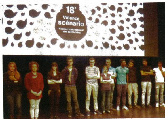
Les jeunes de l'E2C ont été mis à l'honneur.