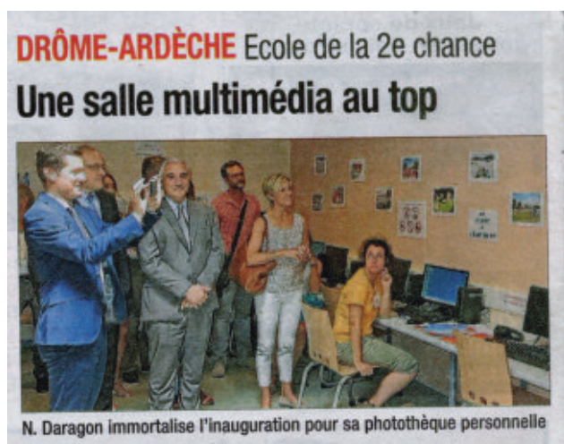
Article du 16 juillet de La Tribune de Montélimar (consultable en intégralité sur le site de l'E2C ).

Un compte privé en ligne donne la possibilité aux jeunes d'accéder à l'ensemble des documents en lien avec leur activité dans le monde du travail, et leur parcours de qualification professionnelle. Cette démarche donne du sens à l'idée de formation tout au long de la vie .