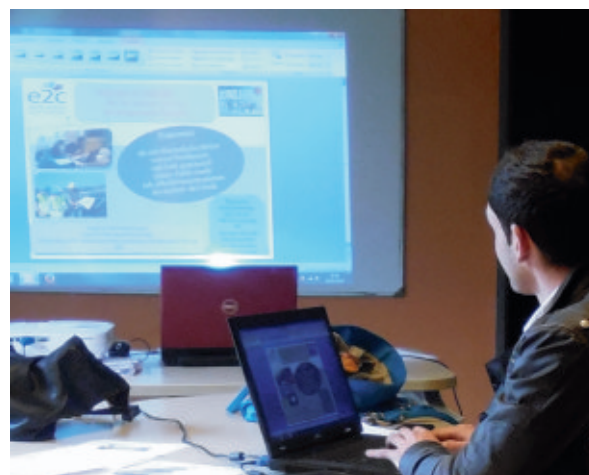
Ordinateurs et ressources numériques sont utilisés quotidiennement par les stagiaires de l'E2C

La Fondation Orange soutiendra ainsi notre projet intitulé « M.I.S.S.I.O.N : Maitriser l'Informatique, Stimuler Son Intérêt, s'Ouvrir au Numérique », qui vise la maîtrise de l'outil informatique par les stagiaires de l'Ecole de la 2ème Chance.