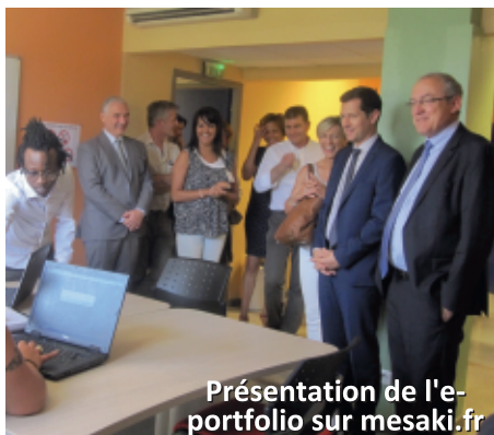
Présentation de l'e-portfolio sur mesaki.fr