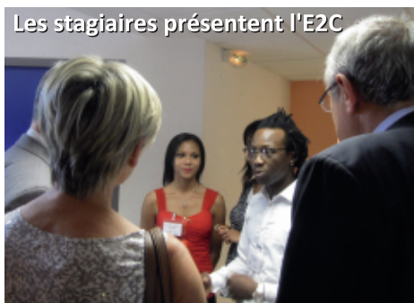
Les stagiaires présentent l'E2C

Les stagiaires avaient préparé une visite un peu spéciale des locaux : à chaque salle correspondait la présentation d'une étape, ou d'un atelier mis en place à l'E2C.