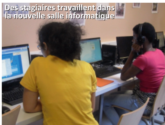
Des stagiaires travaillent dans la nouvelle salle informatique

L'informatique est aussi essentielle dans la définition du projet professionnel des jeunes , ou dans la mise en oeuvre des projets collectifs , même si elle ne remplace pas l'activité "papier, crayon" classique.