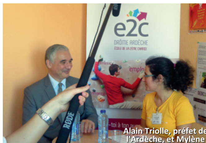
Alain Triolle, préfet de l'Ardèche, et Mylène

Les réponses à ces quelques interrogations des stagiaires (et beaucoup d'autres...) seront bientôt mises en ligne sur le blog... restez connectés !